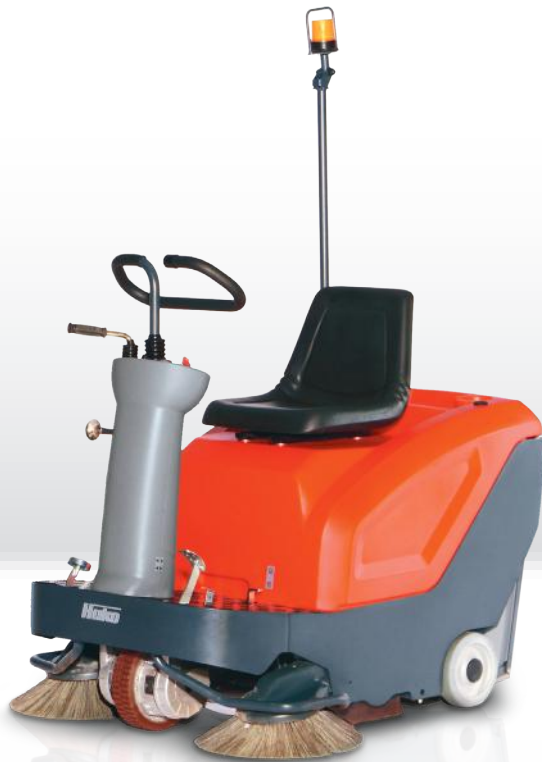
Sweepmaster B800 R